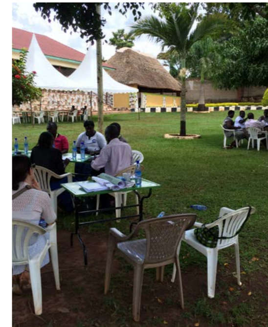
VERSO-ohjelma Ugandassa vuonna 2016.

PLAN international -järjestön kanssa vuodesta 2013 Ugandassa tehty yhteistyö kantaa hedelmää. VERSO-ohjelman ja PLANin Participation School Governance -hankkeen yhteistyö on laajentanut oppilaiden ja opetushenkilöstön sekä opetustyön alueellisten virkailijoiden sovittelu-toimintaa jo lähes koko maan alueelle. Vuonna 2014 yhteistyön tuloksena Ugandan opetuslainsäädännössä kiellettiin oppilaiden ruumiillinen kurittaminen ja tuoreena tietona vuonna 2017 sovittelutyön osaaminen on liitetty osaksi opettajien koulutusohjelmaa. Suomesta PLANin hanketta on tukenut mm. Ulkoministeriö.