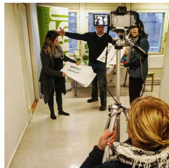
Verson jengillä videon kuvaukset käynnissä.

Viestintätoimisto Ellun Kanojen Pro Bono Respektihaaste haastoi syksyn aikana järjestöjä mukaan petraamaan osaamistaan viestinnän ja erityisesti yhteistyötahojen kontaktien etsimisessä. Haasteen ensimmäisessä vaiheessa mukana olleet järjestöt saivat tehtäväkseen tuottaa muutaman minuutin mittaisen videon, jossa järjestön toiminta on kiteytetty muutama "timanttiin". Näiden pohjalta Ellun Kanat valitsi kymmenen kiinnostavinta jatko. Jatkoilla yhteistyöstä kiinnostuneet eri alojen yritykset ja järjestöt pääsevät etsimään yhteistä arvopohjaa ja kehittämään yhteistyötä, jotta järjestöjen yleishyödyllinen toiminta saa ammattitaitoista Pro Bono-apua tuekseen. Hanke on upea - ja VERSO-ohjelma on jatkossa!